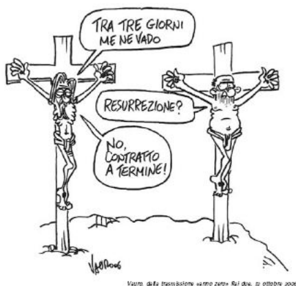
Valtteri dalla trasmissione «Vento zero» Rai due, 12 ottobre 2006

In primo luogo, dopo l'illustrazione di un quadro così drammatico, bisogna chiarire che la partita non è chiusa.